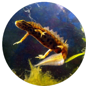
Triton ponctué ( Lissotriton vulgaris )