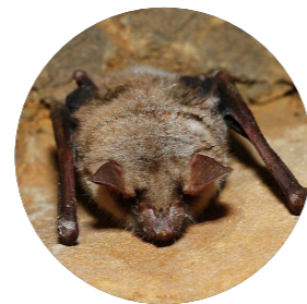
Grand murin ( Myotis myotis )