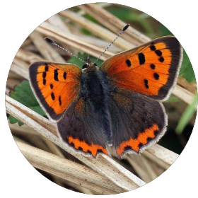
Cuivré commun ( Lycaena phlaeas )