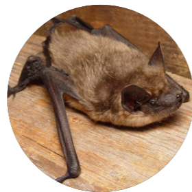
Sérotine commune ( Eptesicus serotinus )