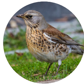
Grive litorne ( Turdus pilaris )