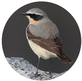
Traquet motteux ( Oenanthe oenanthe )