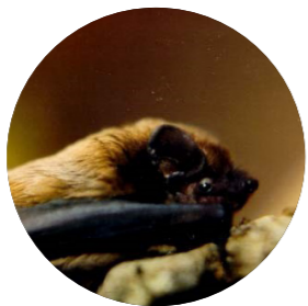
Noctule de Leisler ( Nyctalus leisleri )