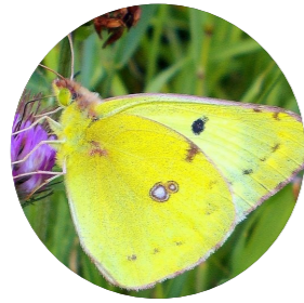
Fluoré ( Colias alfacariensis )